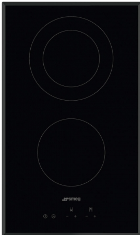
Table de cuisson